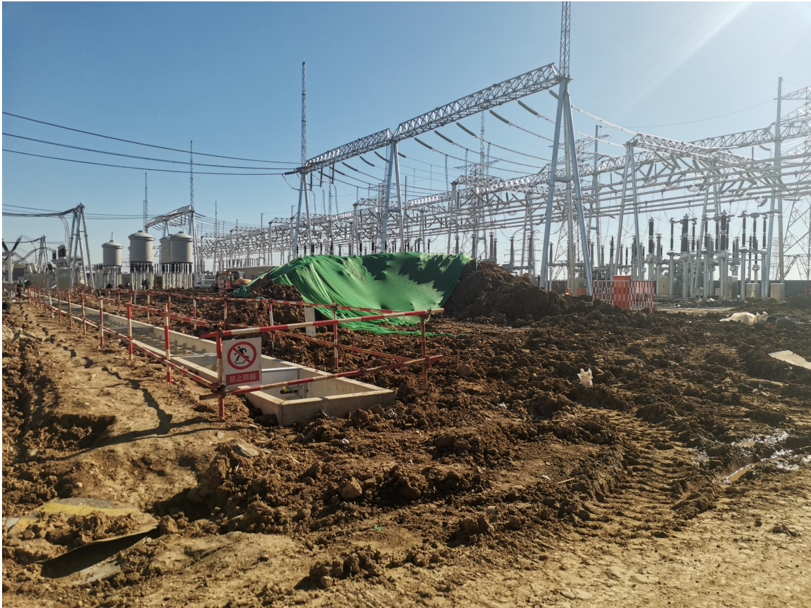
图 3-4 临时措施照片

编织袋装土拦挡 1020m 3 ，密目网布苫盖 85007m 2 ，泥浆沉淀池 108 座。