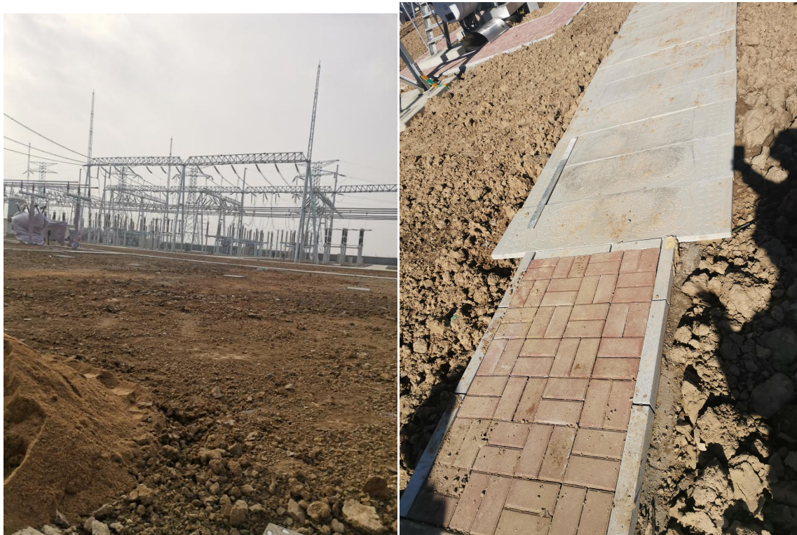
图 3-3 工程措施照片

本项目已完成表土剥离 3.72 万 m 3 ，全面整地 22.34hm 2 ，表土回覆 3.72 万 m 3 ，雨水管线 3158m，混凝土截排水沟 310m，八字浆砌石排水口 1 座，透水砖铺装 1348m 2 。