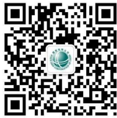
网上国网 95598 微信公众号