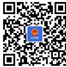
12398 能源监管 热线微信公众号